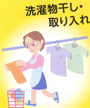
洗濯物干し・ 取り入れ