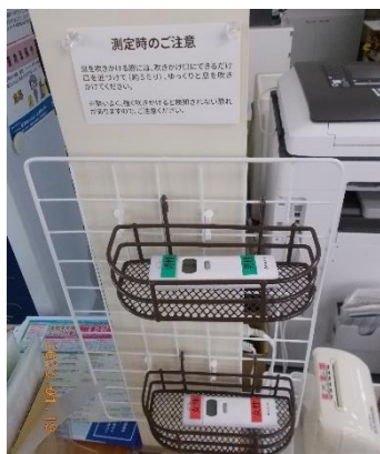
アルコール検知器